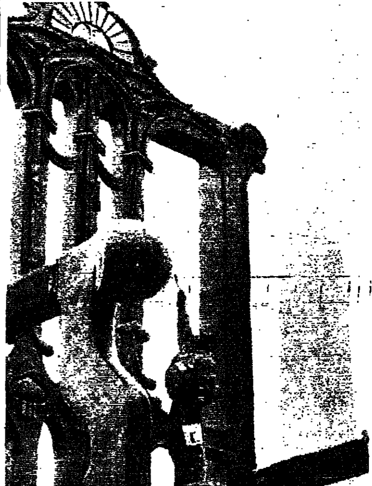
العمل على صنع نموذج لكروسي طلوع الشمس، قارب نهائيه، والمعد الذي يبلغ ارتفاعه ١٧ متراً سيكون واحداً من الرموز التاريخية التي تعرض امام الجمهور في احتفالات تنصيب الرئيس الاميركي الجديد جورج بوش. والمعروف ان الكروسي الاصلي الموجود في قاعة الاستقلال في فيلادلفيا، كان استخدمه جورج واشنطن منذ ٢٠٢ سنة عندما ترأس مؤتمر اعلان الدستور. ويبدو نصب واشنطن في خلفية الصورة.